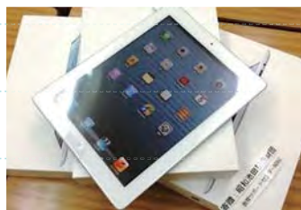
タブレットを使っの授業もあります