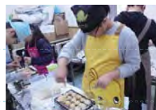
親子もちつき出店企画・たこやきづくり

それぞれの取り組みは、すべて「話し合い」に重きをおきながら取り組まれます。子どもたちは本当に生き生きしながら、学年を超えた仲間と協力し、それぞれのプロジェクトを成功させ、忘れられない“感動体験”を味わいます。