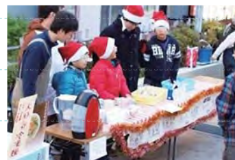
集団での行事にも参加できます

一人ひとりの状況に応じて、支援計画を立て、個別に指導をおこないます。個別指導の基本は教員と生徒の1対1となります。また、クラスと併用してわからないところを重点に学ぶこともできます。