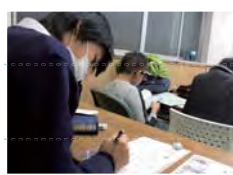
試験前の自習の様子

定期テスト前は、20時間以上の無料補講を実施し、全教科を指導するので安心です。また、勉強の遅れている子どもに対しては、学ぶ意欲を掘り起こし、一人ひとりの学習課題を明確にし、「基礎学力」定着への多様なアプローチを試みます。