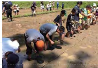
ボランティア・小学生たちと田植え