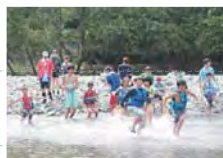
キャンプ・川遊び