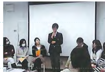
高校3年生を送る会