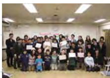
まとめの会・全体集合写真