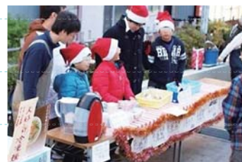
集団での行事にも参加できます

一人ひとりの状況に応じて、支援計画を立て、個別に指導をおこないます。個別指導の基本は教員と生徒の1対1となります。また、クラスと併用してわからないところを重点に学ぶこともできます。