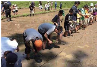
ボランティア・小学生たちと田植え