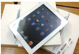
タブレットを使っの授業もあります