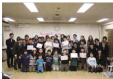
まとめの会・全体集合写真