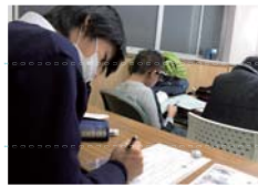
試験前の自習の様子

定期テスト前は、20時間以上の無料補講を実施し、全教科を指導するので安心です。また、勉強の遅れている子どもに対しては、学ぶ意欲を掘り起こし、一人ひとりの学習課題を明確にし、「基礎学力」定着への多様なアプローチを試みます。