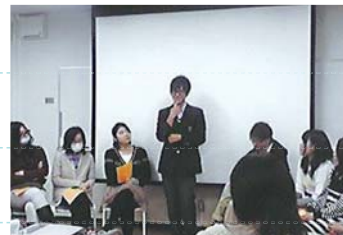
高校3年生を送る会