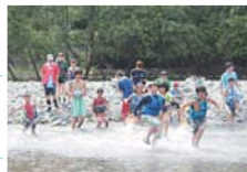
キャンプ・川遊び