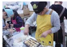
親子もちつき出店企画・たこやきづくり

それぞれの取り組みは、すべて「話し合い」に重きをおきながら取り組まれます。子どもたちは本当に生き生きしながら、学年を超えた仲間と協力し、それぞれのプロジェクトを成功させ、忘れられない「感動体験」を味わいます。