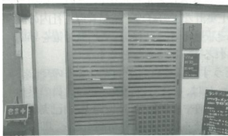
小料理屋のような入り口