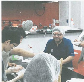
(左上から時計回りに) エルムのスポーツ大会で自分や仲間のがんばりに涙する子ども、種地はるにれを掃除する若者、沖縄戦をテーマにした平和劇を演じる子どもたち、NIREの仕事体験